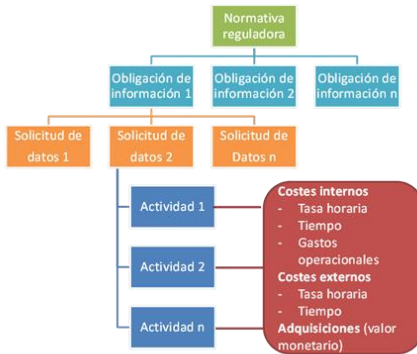
Diagrama 1 ESTRUCTURA METODOLÓGICA DEL MODELO DE COSTOS ESTÁNDAR

Fuente: Manual Internacional del MCE, OCDE (2004: p.13) Elaboración: Gerencia de Estudios Económicos del Indecopi.